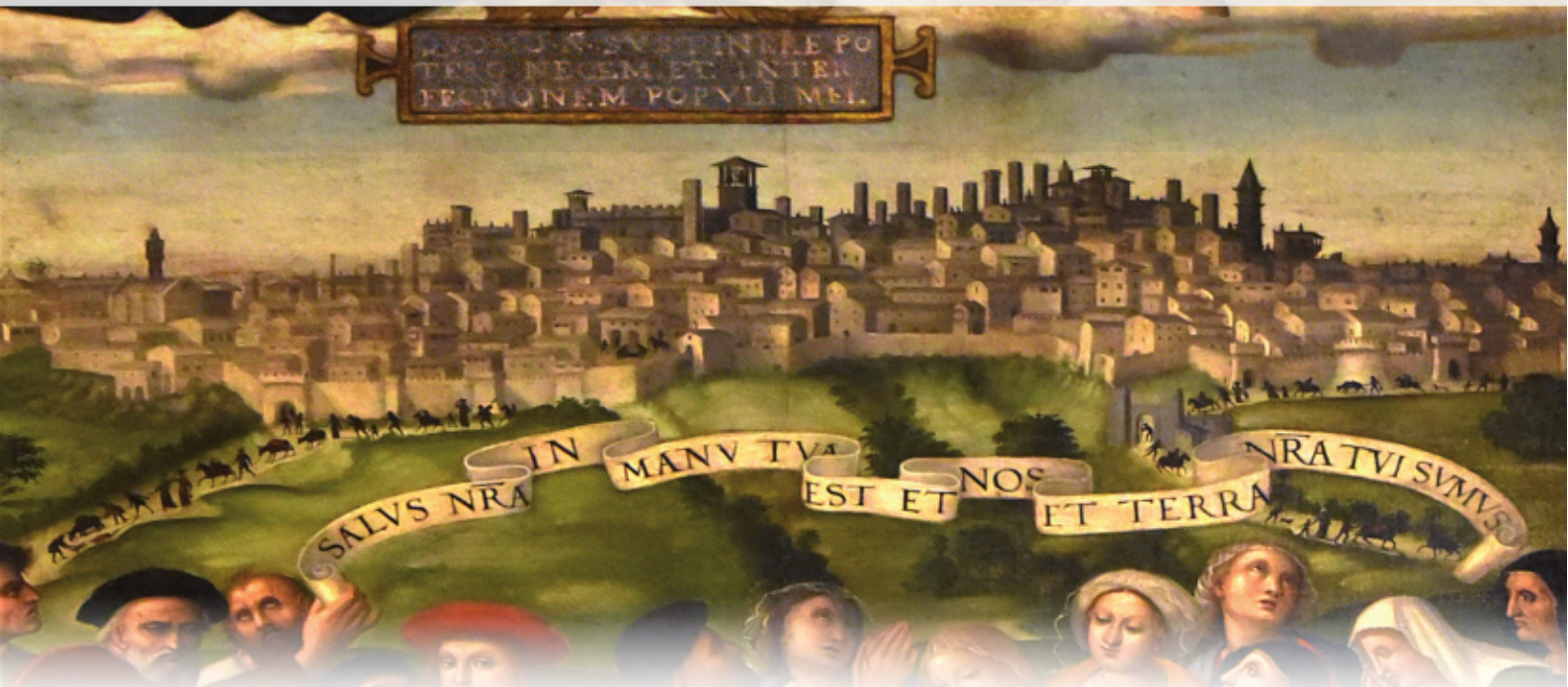
Particolare panoramico di Perugia e le sue torri, raffigurata nel XVI secolo. Dall'Opera di Berto di Giovanni "Pala del Gonfalone" (1526), esposta nella Cattedrale di San Lorenzo in Perugia.